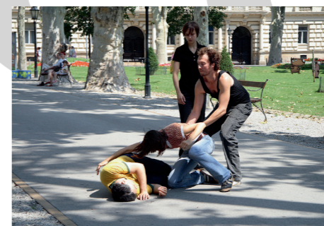
Igor Grubić: Zgodba z vzhodne strani / East Side Story / Priča sa Istočne strane , foto / photo, 2008.

Zgodba z vzhodne strani East Side Story Priča sa Istočne strane